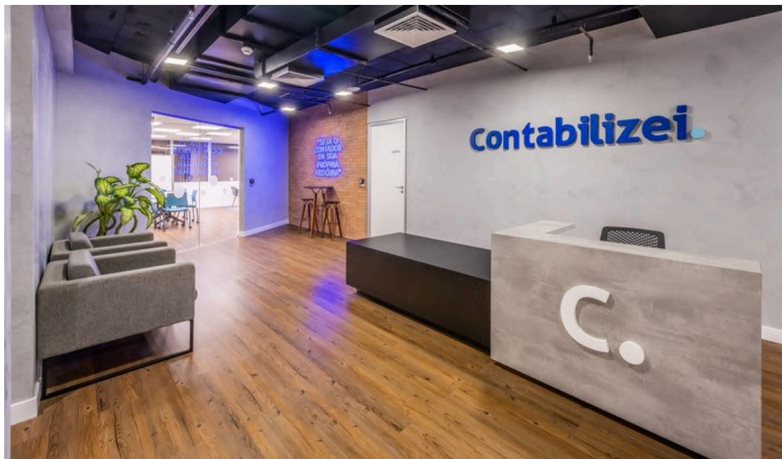
Contabilizei investe no primeiro escritório próprio em São Paulo

Categorias: Empresas Notícias Design Arquitetura Móveis Marcenaria